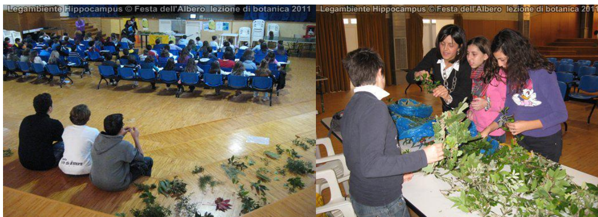
Lezione in auditorium sul tema ambientale a cura della prof.ssa Scatigna